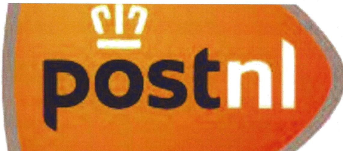
POST NL

17 APRIL 2021 ADMINBUSINESSPLAN , HOME , LOCATIE , MEDIA , RIDDERBOEKO