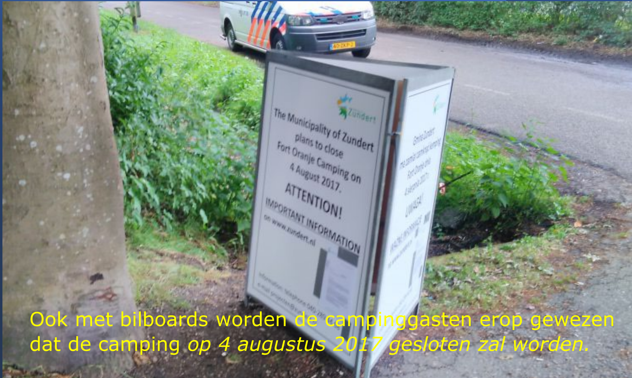
Ook met bilboards worden de campinggasten erop gewezen dat de camping op 4 augustus 2017 gesloten zal worden.