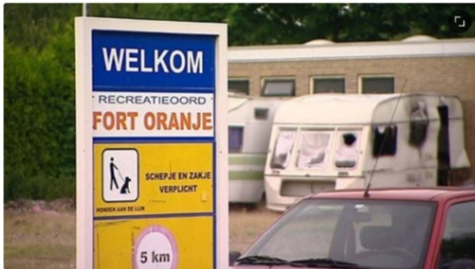
Camping Fort Oranje (archieffoto)

De politie heeft woensdagmiddag weer een grote controle gehouden bij de omstreden camping Fort Oranje aan de Bredaseweg in Rijsbergen. Er werden bekeuringen uitgeschreven en twee mensen zijn aangehouden.