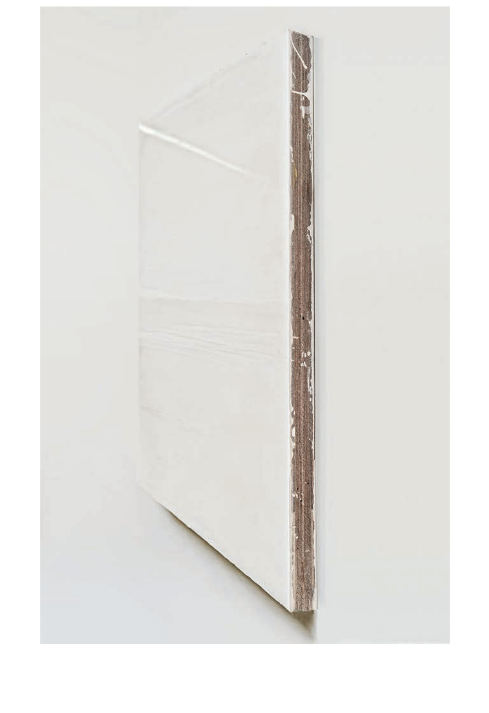
Willy de Sauter