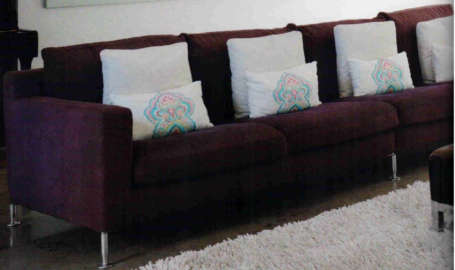
Het hoogpolige kleed van Format verzacht de strakke vloer van travertin. De bank en fauteuils zijn van B&B Italia en de grote poef is van Minotti. Het kunstwerk met de schaapjes is van Rob Scholte. De witte tafellamp is van Kartell. Overal in huis zijn doorkijkjes naar de parkachtige tuin.