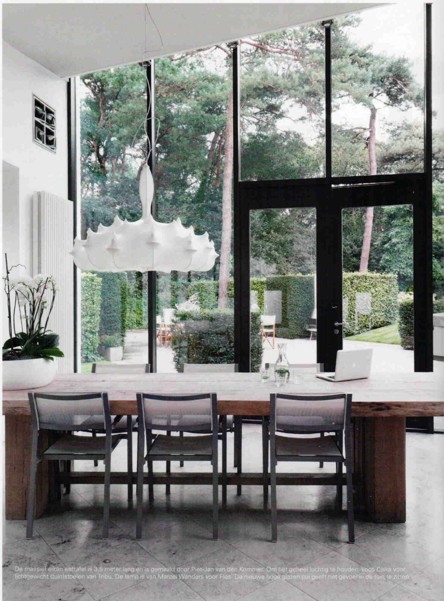
De massief eiken eettafel is 3,5 meter lang en is gemaakt door Piet-Jan van den Kornier. Om het geheel lichtig te houden, koos Ciska voor lichtgewicht (tuin)stoelen van Tribu. De lamp is van Marcel Wanders voor Flos. De nieuwe hoge glazen pui geeft het gevoel in de tuin te zitten