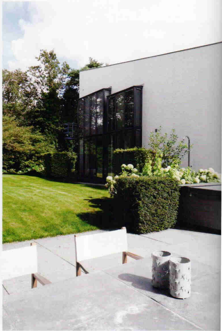
De moderne villa, een ontwerp uit begin jaren negentig van architect Peter Thoes uit Amsterdam, is opgebouwd uit meerdere speels met elkaar verbonden volumes die de tuin omarmen en het groen als het ware het huis binnen brengen.

“Ik heb van geen enkele keuze spijt. Het is altijd weer heerlijk om thuis te komen”